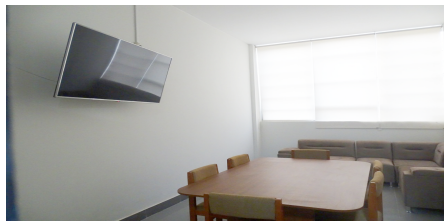
Sala de investigación

2º Salas de investigación. Cabe referir que el decanato de la Facultad de Letras y Ciencias Humanas ha dispuesto para uso de los estudiantes y docentes de pregrado y posgrado, de tres salas académicas, las mismas que se encuentran en el área de Investigación y Posgrado y debidamente equipadas. El proceso para separar estos ambientes se solicita en la secretaria de VIP-FLCH..