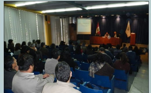
Taller del Comité Interno de Autoevaluación (CIAEL).