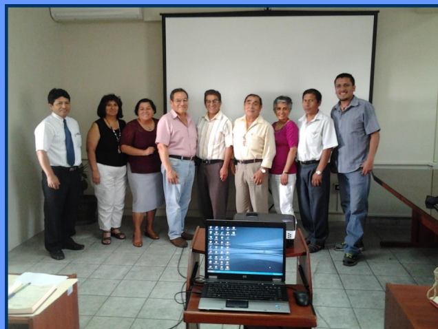
Docentes miembros del CIAEL y asesores de la OCCA

El CIAEL es el ente que organiza y monitorea el acopio de información a fin de obtener y verificar datos que ya existen en diferentes documentos de la Escuela y de la Facultad. Asimismo, a través de encuestas y entrevistas, el CIAEL busca obtener datos pertinentes de los estudiantes, de los docentes y del personal administrativo. Como se puede ver, en dicho proceso estamos implicados todos los que participamos en la formación académica de los futuros lingüistas e investigadores sanmarquinos. En tal empresa, el CIAEL espera contar con los valiosos aportes de cada uno de los miembros de los tres estamentos de la Facultad.