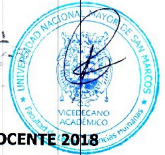
TABLA DE EVALUACIÓN - CONCURSO PÚBLICO PARA CONTRATO DOCENTE 2018